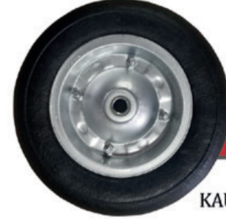
KESKİN HAVALI KAUÇUK BURÇLU TEKER Keskin pneumatic rubber bushing wheel